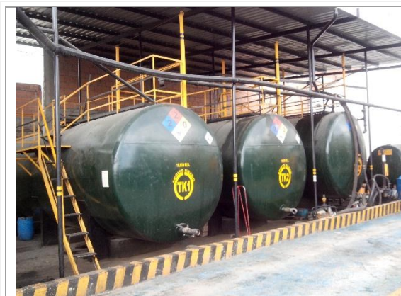
Foto No. 1 Zona del predio donde se almacena los aceites usados, área separada de la actividad de tratamiento de borras.

El área donde funcionan las dos empresas se encuentra fuera de la zona de ronda como se estableció en el numeral anterior, el área que se encuentra en zona de ronda realiza actividades la empresa LASEA SOLUCIONES EU, el cual ocupa 694m 2 del área del predio, donde se trabaja con el almacenamiento de respel, esta empresa cuenta con su respectiva licencia ambiental mediante Resolución 3010 de 2005 modificada por la resolución 933 de 2008. Es de informar que éste tema se tratará mediante las actuaciones de control o de seguimiento al usuario y que no es el objetivo de este informe técnico.