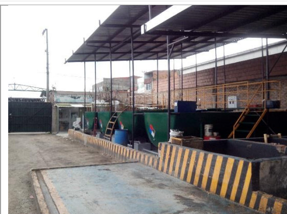
Foto No. 2 Zona del predio donde se realiza la actividad de tratamiento de borras, área aparte de la zona de acopio secundario de aceite